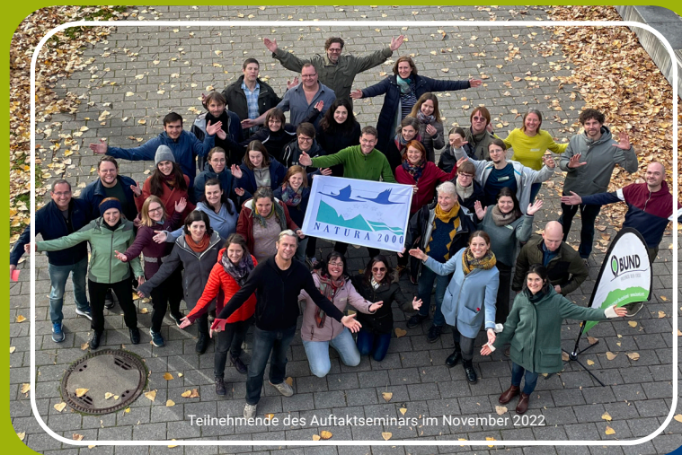
Teilnehmende des Auftaktseminars im November 2022